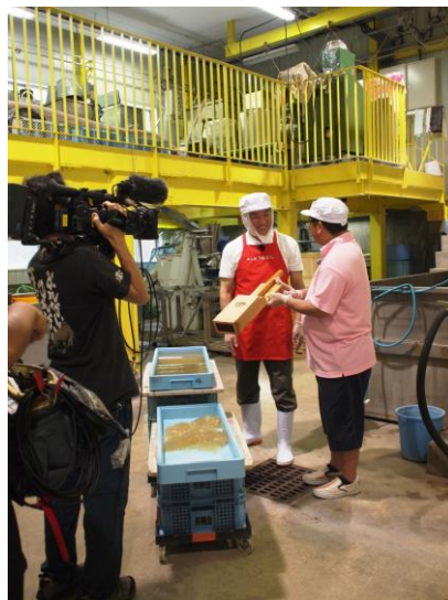
撮影の段取り？談笑？