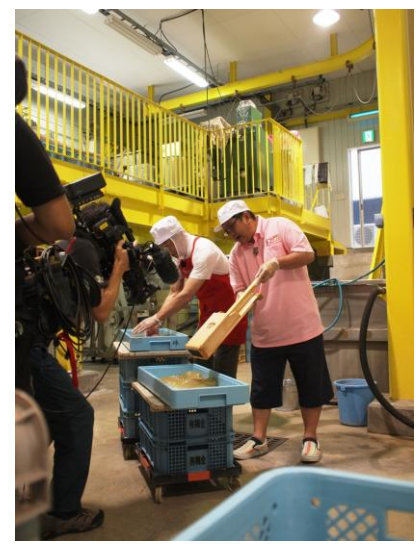
仕事のお手伝いシーン撮影